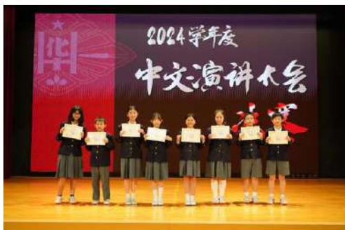
小五六组获奖者合影