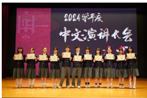
中学组获奖者合影